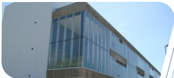
Instituto tecnologicas biomédicas.