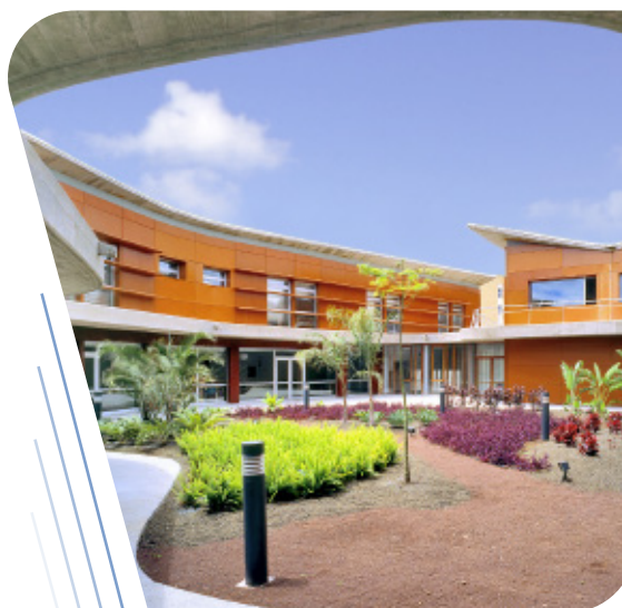
Hospital Nuestra Señora de Los Dolores.

La funcionalidad programática y la eficiencia tecnológica son la base del diseño, y a ello añade la contextualización medioambiental y la búsqueda de espacios equilibrantes. Conciben los edificios según las características físicas y climáticas del entorno en que se ubican, incorporando criterios bioclimáticos para rentabilizar la energía y conseguir mayor sostenibilidad y mayor confort. El principal activo es el equipo humano, un equipo multidisciplinar especializado y con compromiso de excelencia, compuesto por arquitectos, ingenieros, especialistas medioambientales y en accesibilidad. La empresa posee la Certificación UNE EN ISO 9001 de sistema de Gestión de la Calidad.